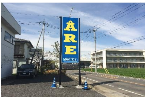
店舗の認知度向上を狙った看板(サイン)の設置