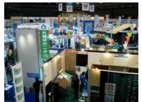
販路開拓のための展示会出展