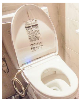
トイレの洋式化改修