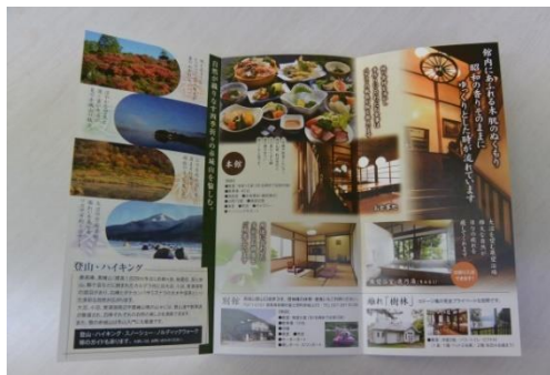
PRの強化を目的としたチラシやパンフレットの作成