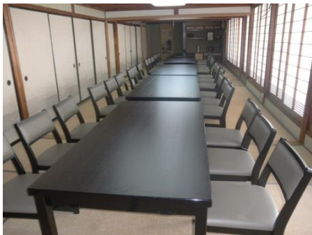
新規顧客獲得のための新設備・什器導入